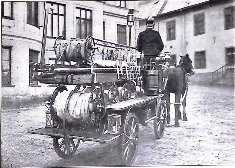
Faluns Brandkårs redskapsvagn.