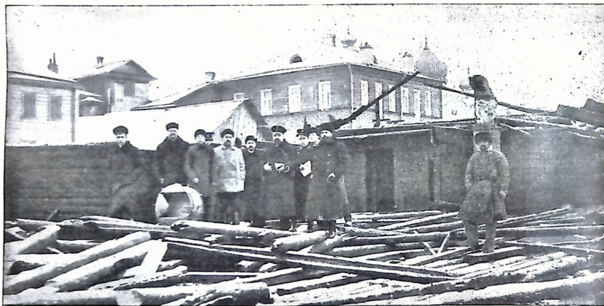
Efter biografteaterns i Bologoje brand.

Den stora fabriksbranden i Göteborg. Beskrifningen kan ej nu intagas på grund af bristande utrymme.