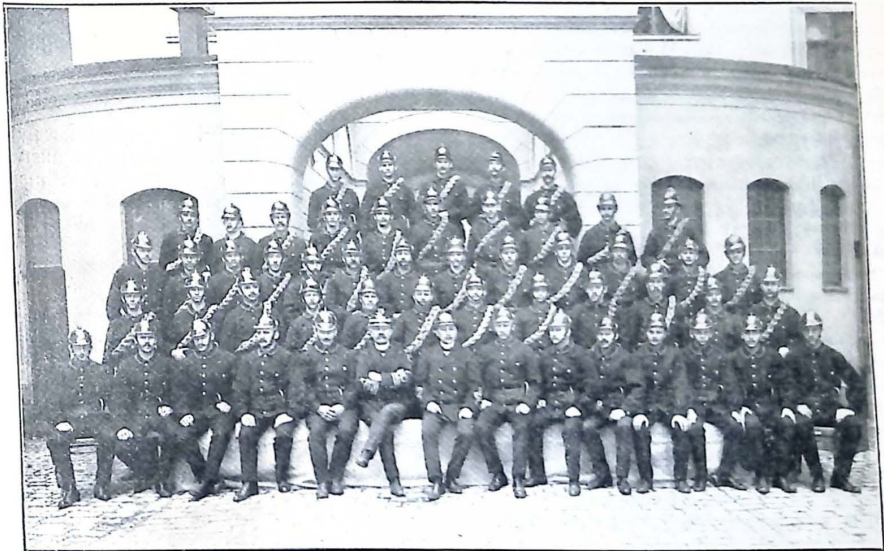
Grupp af Eskilstuna brandkår.

Eskilstuna stads fasta brandkår, som i sitt ungefärligen nuvarande skick uppsattes år 1897, består af en mindre kasernerad samt en större icke kasernerad styrka.