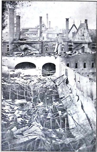
Efter branden vid Tattersall.

I användning voro inalles 23 slangledningningar, hvar af 5 voro utlagda från de båda från Nybroviken gående sjöängspruteledningarna, hvardera ångsprutan, 2 från automobilsprutan och 12 från 7 brandposter.