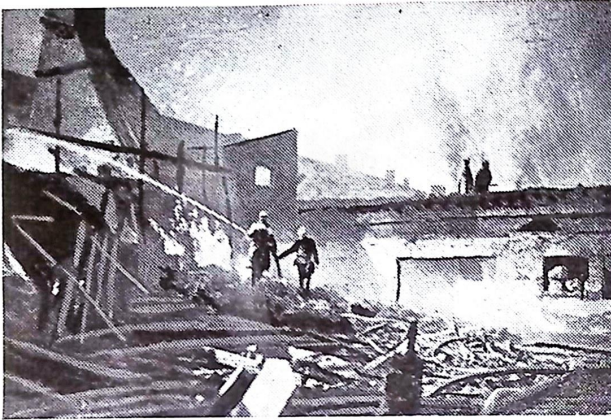
Från branden i Göteborg.

Har ett golf blifvit fullständigt förkolnadt på öfre sidan, så är det naturligtvis omöjligt att på detsamma upptäcka några spår efter utgjutna antändningsmedel, såsom fotogén, ty sådana vätskor brinna gifvetvis först upp. Men det skulle vara oriktigt att i sådana fall utan vidare afstå från en fortsatt undersökning af golfvet. Då nämligen golfspringorna lätt släppa igenom vätskor, bör man bryta upp golfplankorna samt undersöka sidorna och dammet under dem. Genom att upp-bryta golfvet lyckades det en gång att flera må- under efter en eldsvåda påvisa fotogén i fyllningen under golfvet. Det är mycket lämpligt att i sådana fall i protokollet noga anteckna platsen för upptäckten samt äfven att bifoga en teckning, enär fotogénspärens läge och utbredning kunna gifva anledning till flera värdefulla slutsatser.