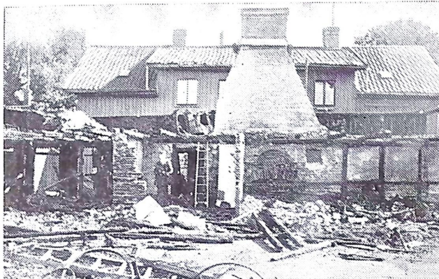
Från branden i Göteborg.

icke heller i smedjan, som ej besökts sedan kl. 2 på middagen kan elden — som det uppgives — ha uppkommit, och att den skulle ha utbrutit i hr Fränkels upplag — såsom en tidning antagit — synes föga troligt. Några oljor förvarades icke i denna lokal, som för öfrigt icke besökts under eftermiddagens lopp, åtminstone icke med ljus.