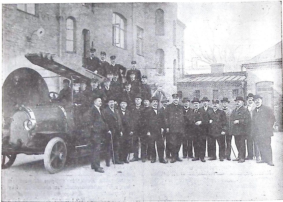
Grupp af deltagarne i årsmötet i Västerås.

Stadgar för en blifvande understödskassa antogs, och komma dessa stadgar jämte stipendiefondens och förbundets stadgar att tryckas ge-