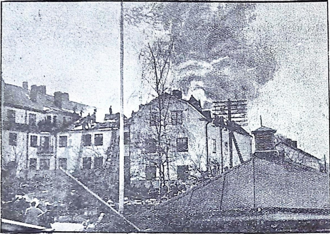
Från branden i Norrtelje nya teater.

Medan brandmännen höll på med släckningen i en af de nedre våningarna, började det