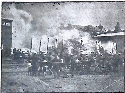
Eldhärden sedd från järnvägen.

kären fortfarande höll slangarna i verksamhet. Eftersläckningen pågick omkring ett dygn innan elden var fullkomligt släckt.