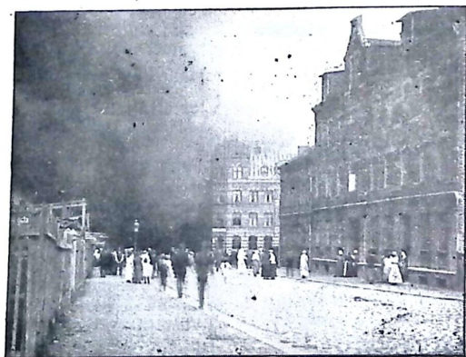
Spolegatan under branden.

För släckningen användes 10 slangledningar,