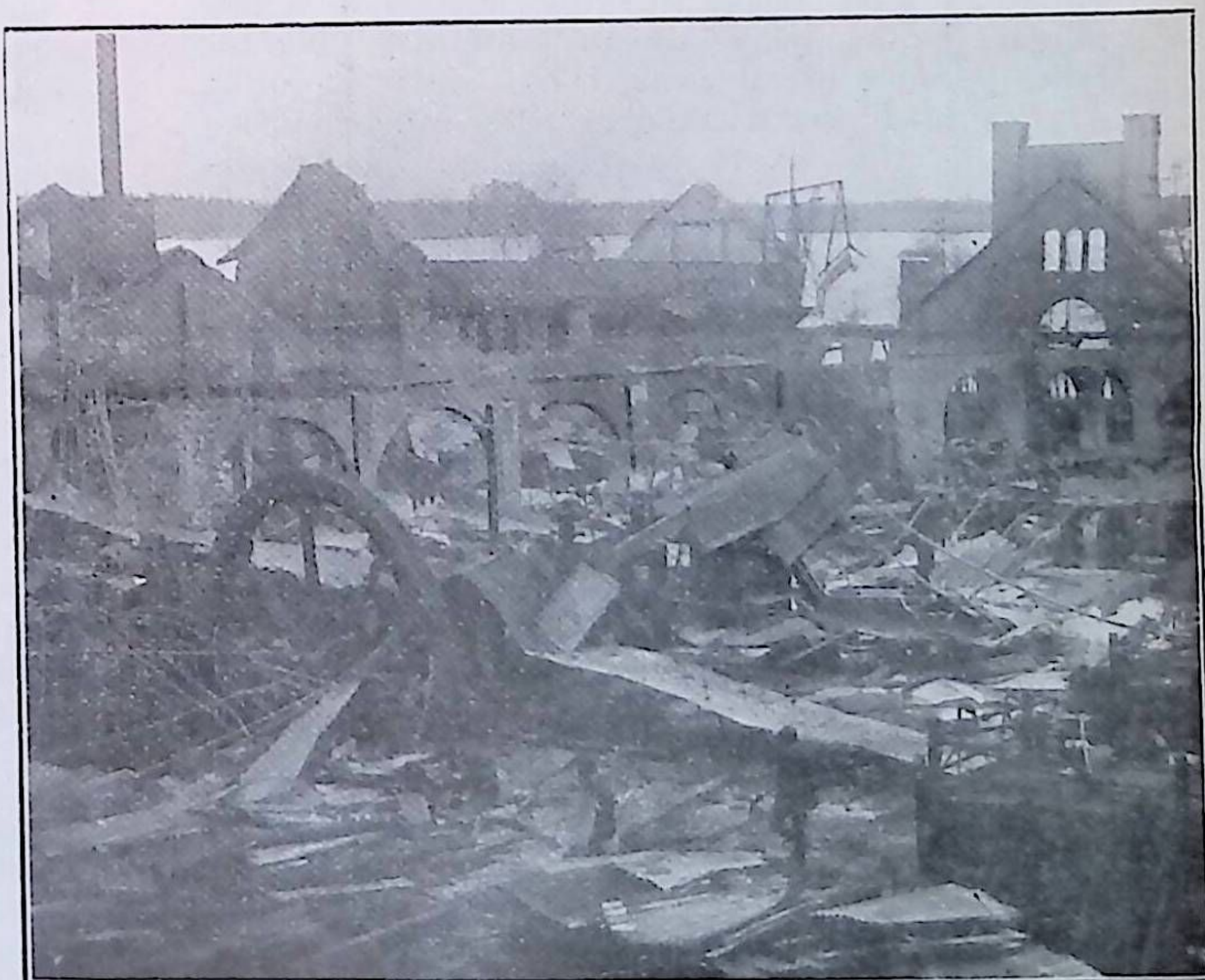
Från branden i Skultuna. Tillhör beskrifningen i N:o 2.

Ägaren fullföljde besvären. Reg. R. utsl. den 28 september 1909: Reg. R. finner bevären icke förtjäna afseende.