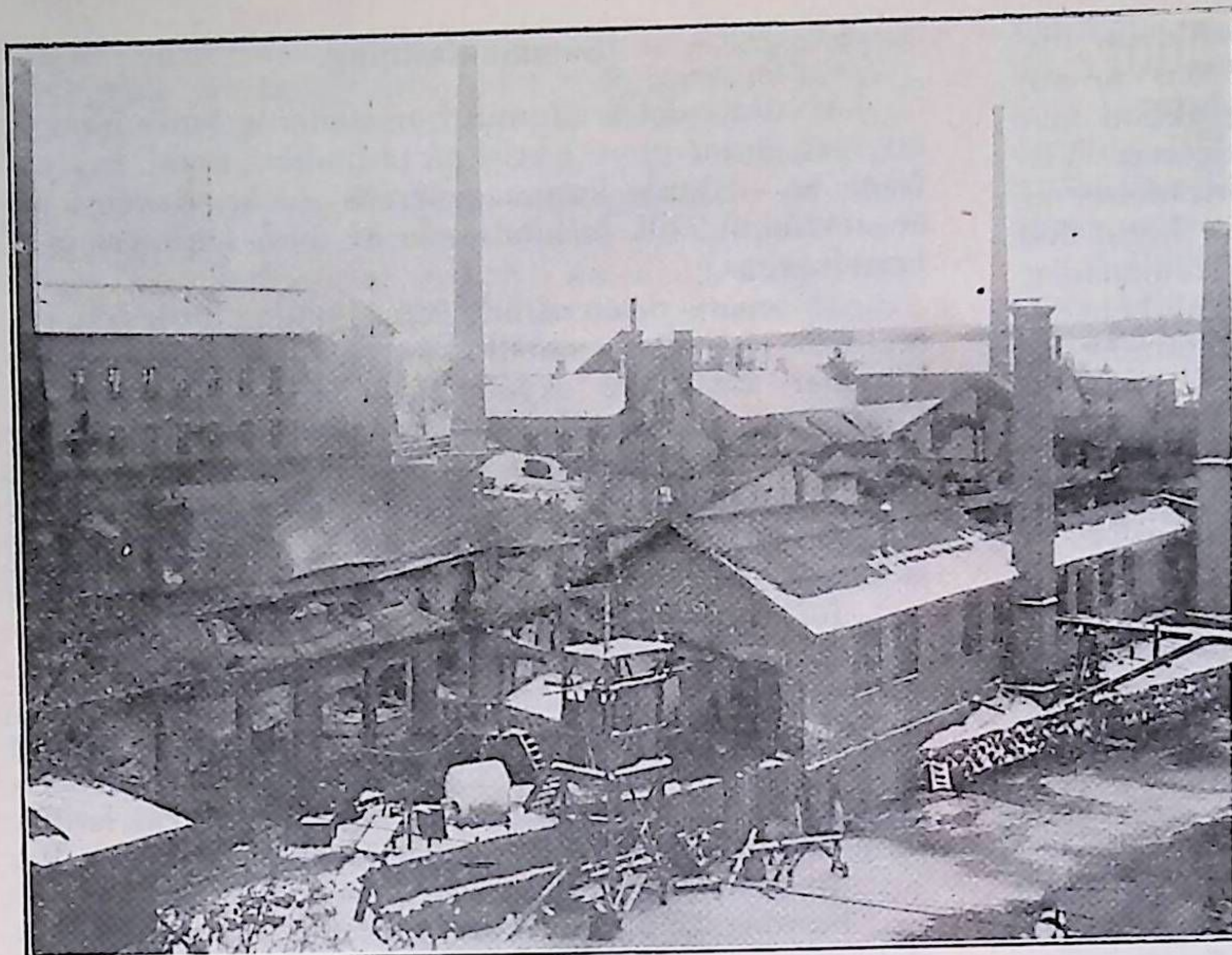
Från branden i Skultuna. Tillhör beskrifningen i N:o 2.